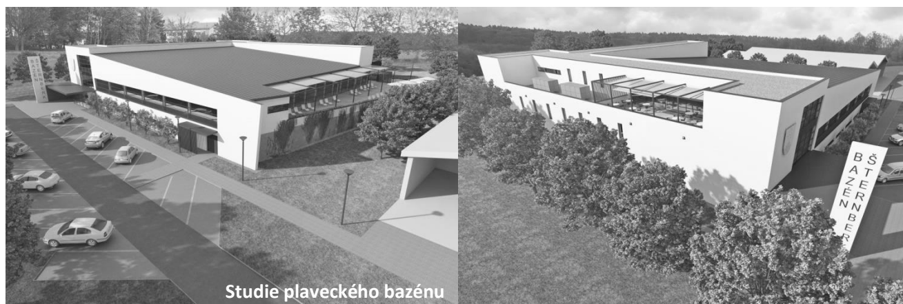
Studie plaveckého bazénu

Stavba krytého bazénu je navržena na pozemcích ve vlastnictví města vymezených platným územním plánem pro plochy rekreace. Řešený areál sousedí s areálem nemocnice a budoucím areálem atletického stadionu.