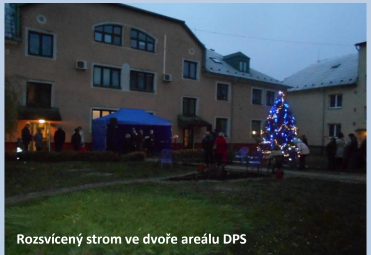
Rozsvícený strom ve dvoře areálu DPS