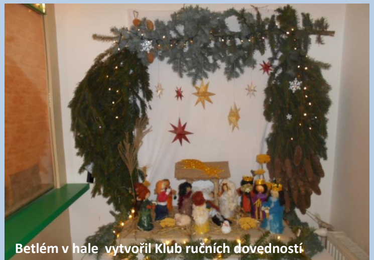
Betlém v hale vytvořil Klub ručních dovedností