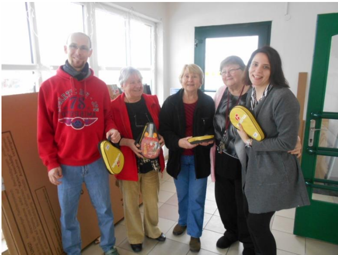
Předávání dárků od Ježíškových vnoučat – stůl na ping – pong