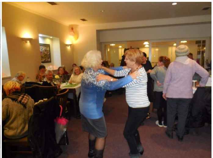
Setkání Klubů seniorů s představiteli města