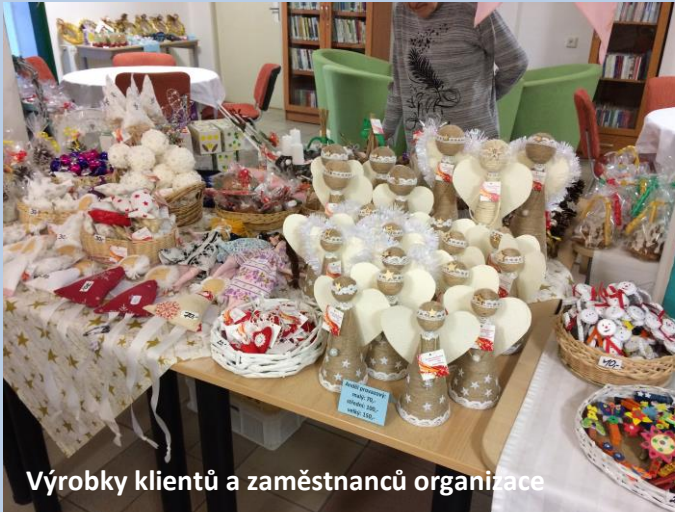
Výrobky klientů a zaměstnanců organizace