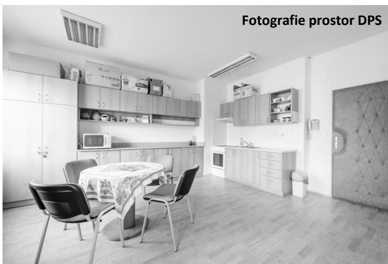
Fotografie prostor DPS

Na závěr bych si dovolil uvést a vyvrátit jeden velmi častý mýtus. Často se setkávám s žadateli, kteří mají představu, že když se přestěhují do bytu zvláštního určení, bude jim zajištěna bezplatná a celodenní péče, jak tomu bývá například v domovech pro seniory. Vždy jim vysvětluji, že se nejedná o „domov důchodců“, ale jde o samostatné byty, kde si můžou sjednat pečovatelskou službu, stejně jako to můžou udělat už nyní ve svém bytě. Nežřídká se pak stane, že si potřebnou pečovatelskou službu sjednají a stěhování do bytu zvláštního určení je pak pro ně nadbytečné.