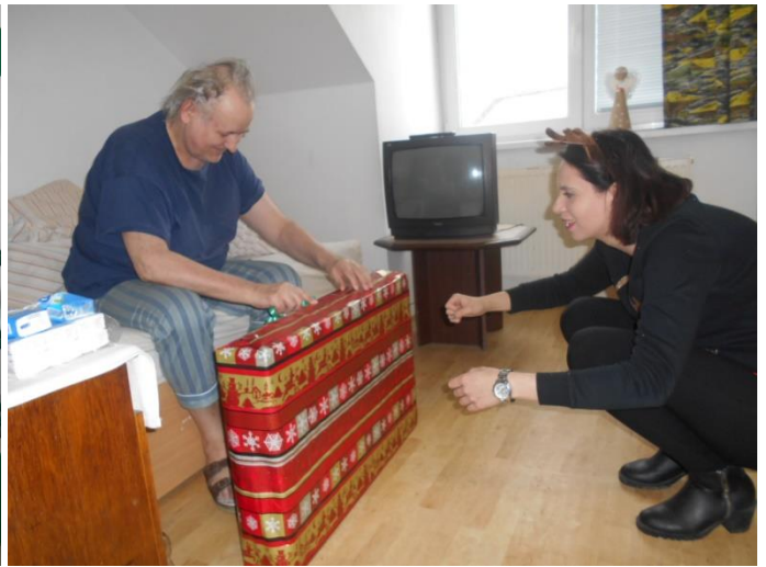
Předávání dárků od Ježíškových vnoučat - televizor