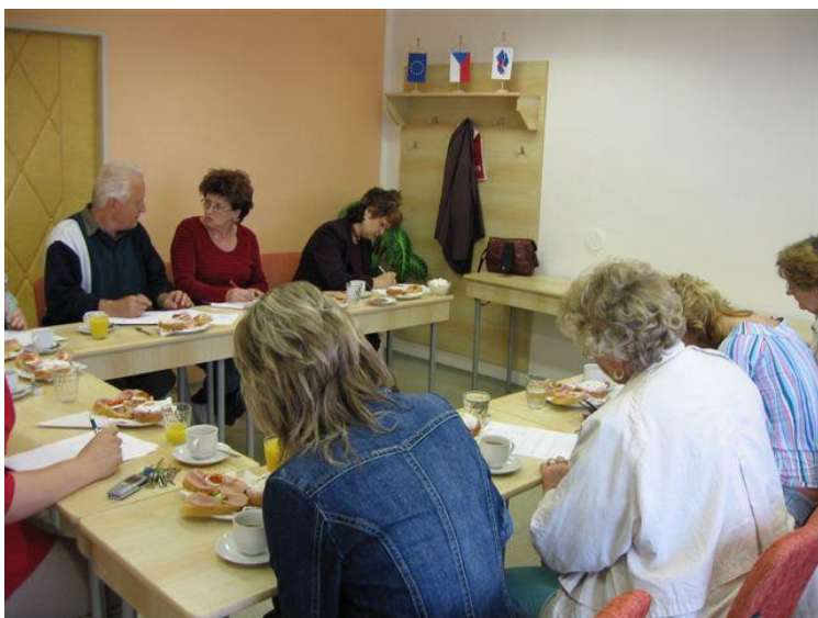
Pracovní porada s lektory rok 2006