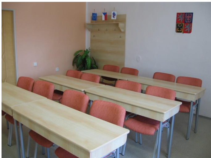
První učebna z roku 2006