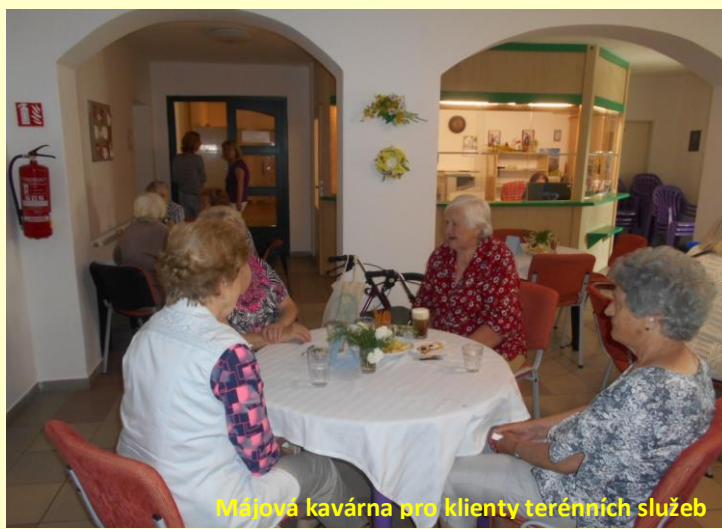
Májová kavárna pro klienty terénních služeb