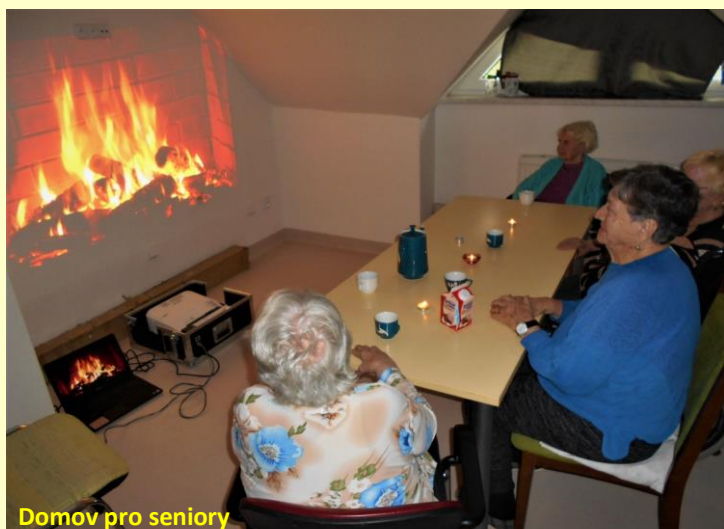
Domov pro seniory