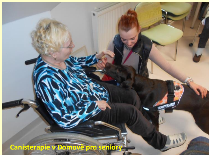
Canisterapie v Domově pro seniory