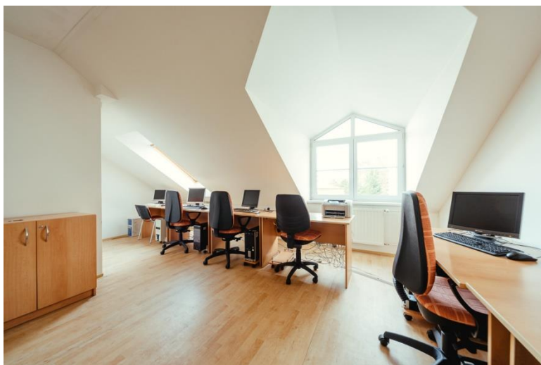
Učebna počítačů a veřejného internetu z roku 2006