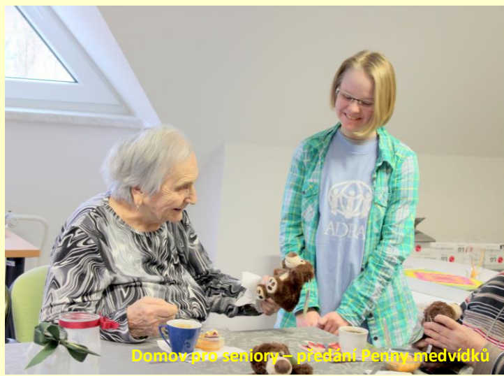
Domov pro seniory – předání Peniny medvídků