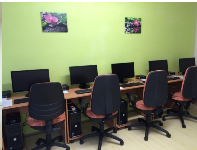
Učebna Klubu práce na PC a internetu rok 2018