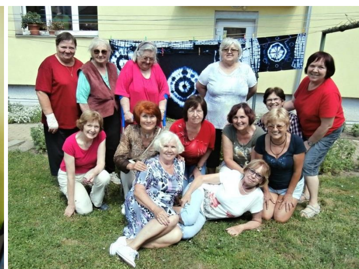
Klub ručních dovedností

Zpravodaj je vydáván pouze pro interní potřebu organizace Sociální služby Šternberk, p. o.