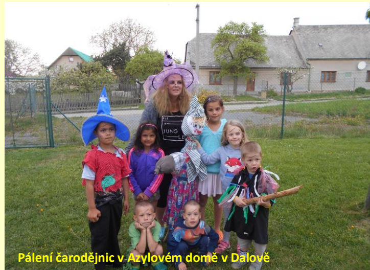
Pálení čarodějnic v Azylovém domě v Dalově