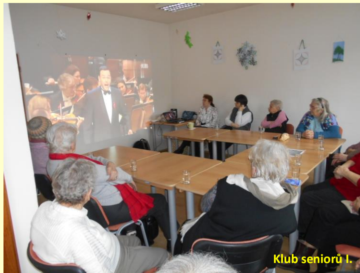
Klub seniorů I.