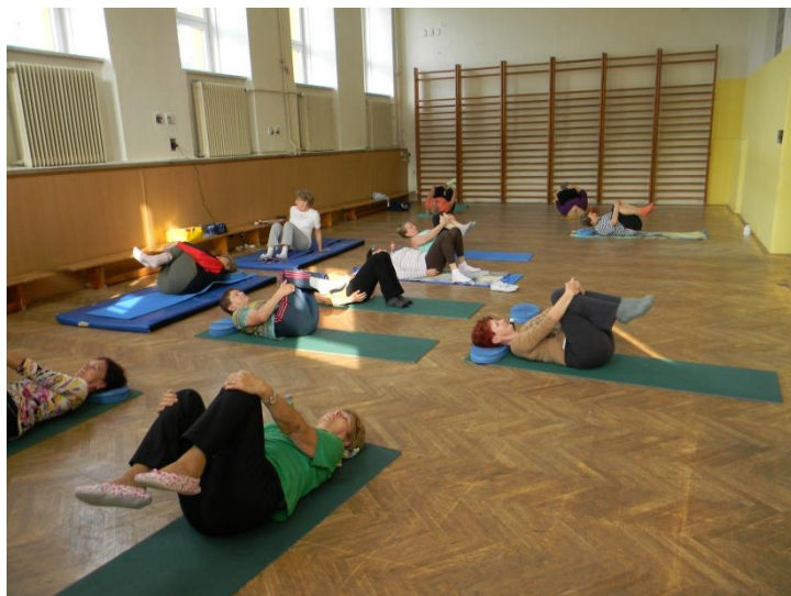
Jóga pro zdraví