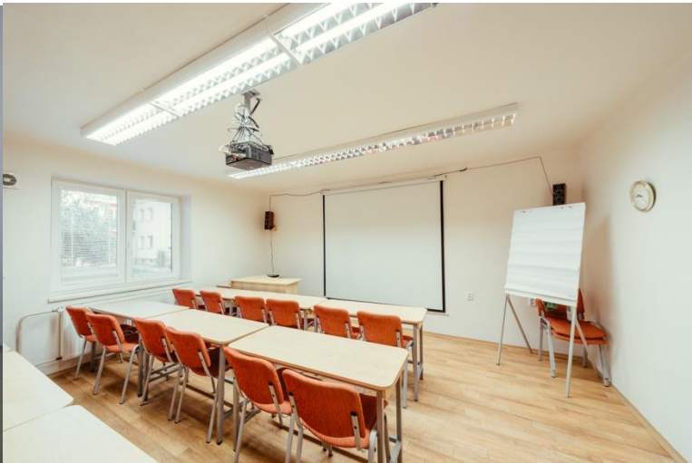
Učebna rok 2018