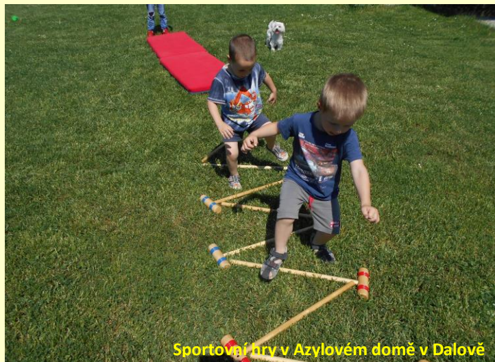
Sportovní hry v Azylovém domě v Dalově