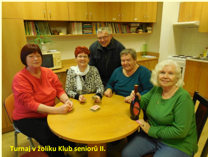
Turnaj v žolíku Klub seniorů II.