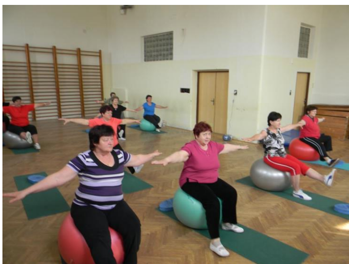
Aktivizační cvičení pro seniory