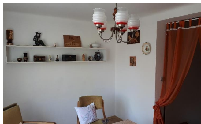
Retro koutek v DPS

Zpravodaj je vydáván pouze pro interní potřebu organizace Sociální služby Šternberk, příspěvková organizace