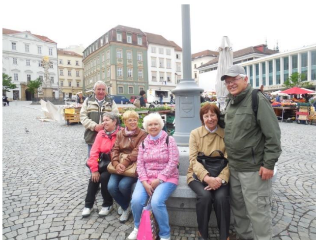
Výlet Klubu seniorů II. do Brna