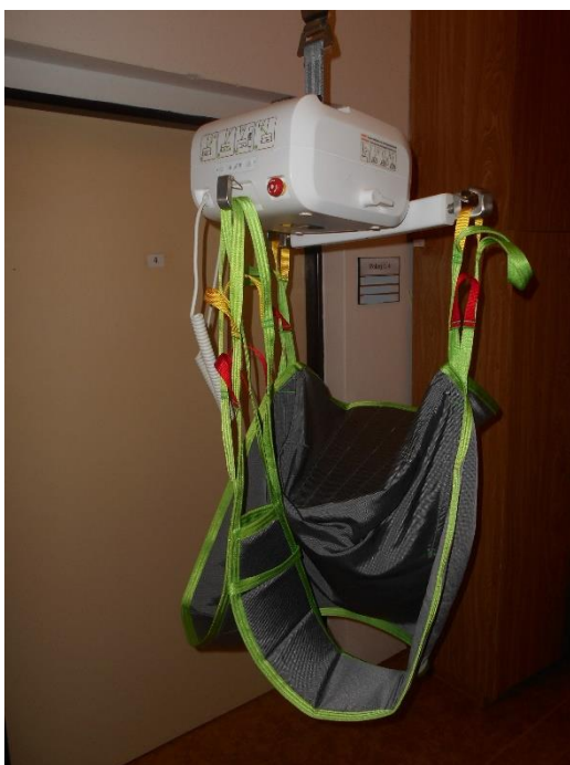
Stropní zvedací zařízení v domově pro seniory