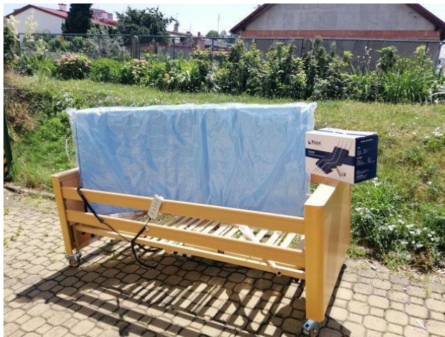
Pomůcky do Půjčovny kompenzačních pomůcek