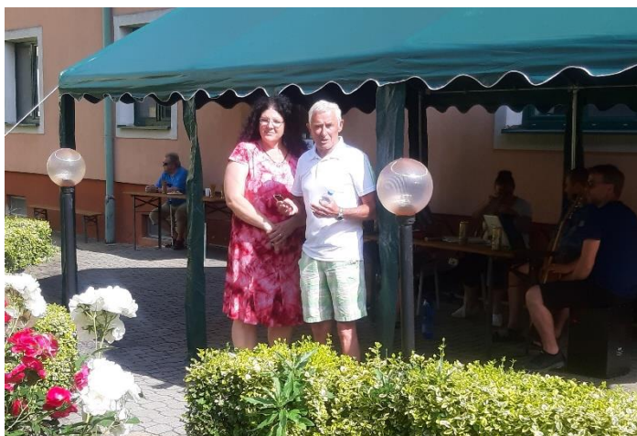
Setkání klubů seniorů s obyvateli DPS