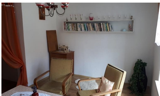
Retro koutek v DPS