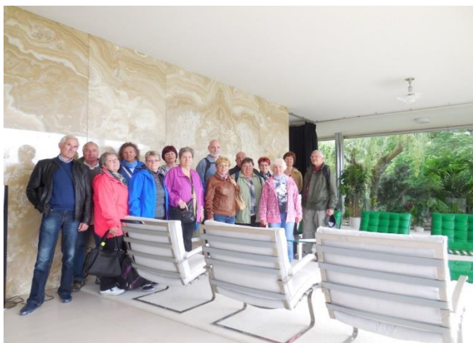
Výlet Klubu seniorů II. do Brna