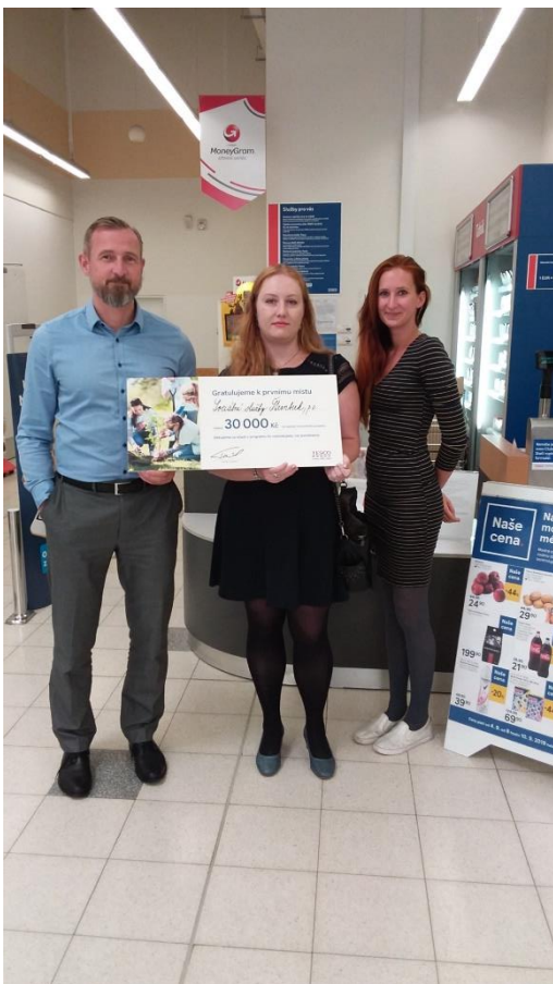
Předání šeku pro azylový dům