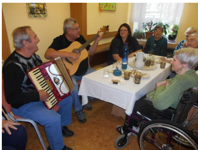
Den otevřených dveří v domově pro seniory