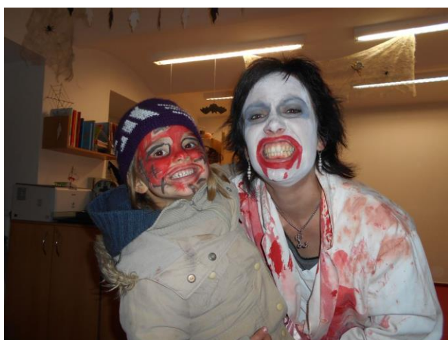
Haloween v azylovém domě