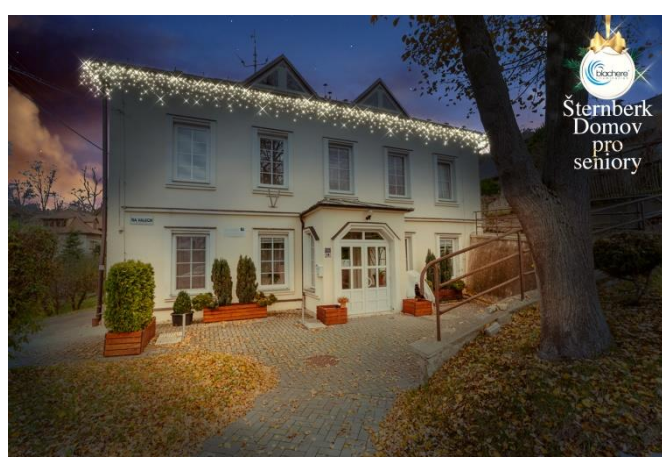
Vizualizace vánočního osvětlení Domova pro seniory Šternberk, Na Valech 14

Zpravodaj je vydáván pouze pro interní potřebu organizace Sociální služby Šternberk, p. o.