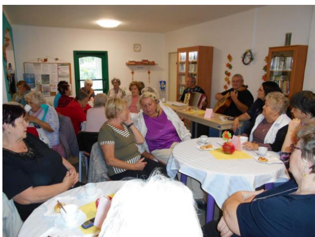
Den otevřených dveří v DPS Komenského 40