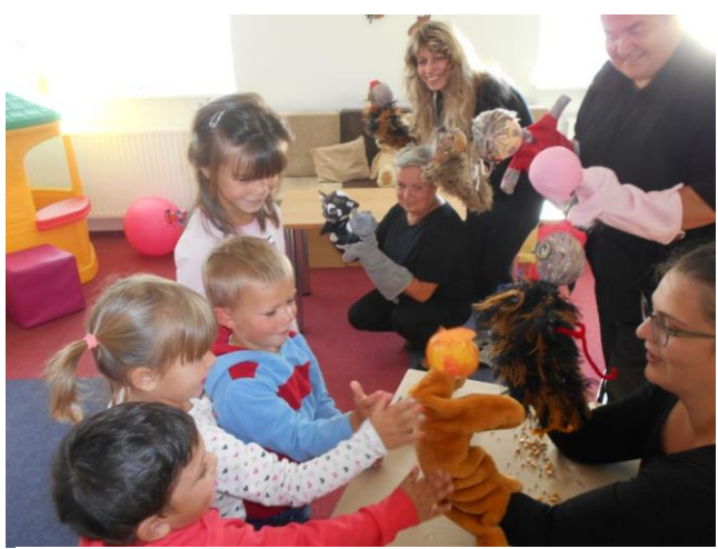
Den otevřených dveří v azylovém domě

Zpravodaj je vydáván pouze pro interní potřebu organizace Sociální služby Šternberk, p. o.