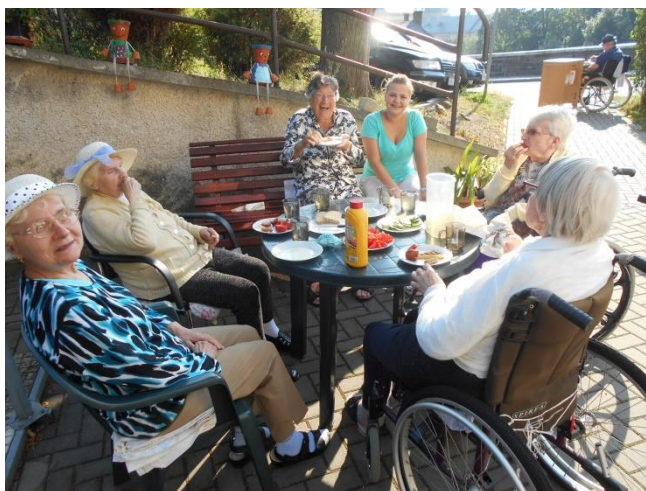
Grilování v domově pro seniory