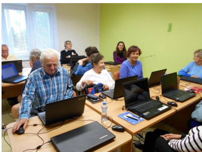
Počítačový kurz projektu „Senioři komunikují“