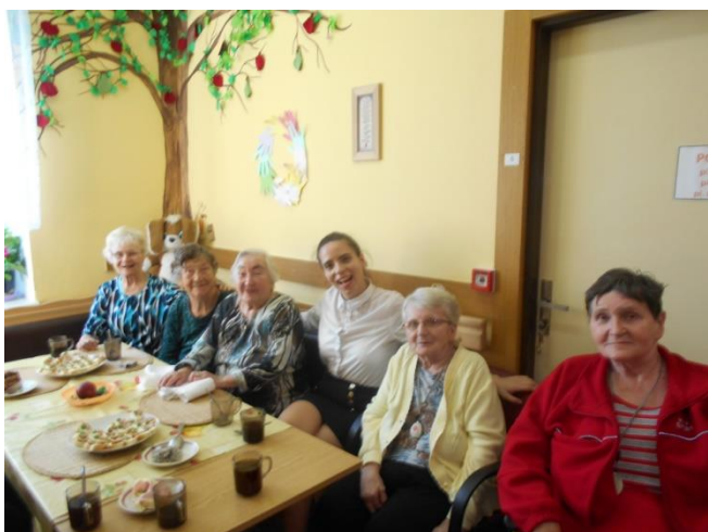
Den otevřených dveří v domově pro seniory