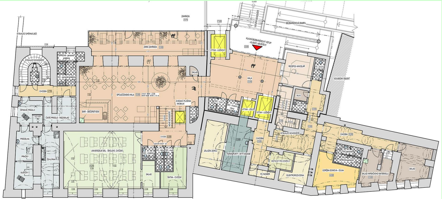
PŮDORYS 1. PP OPAVSKÁ 4 ← → OPAVSKÁ 2 PŮDORYS 1. PP