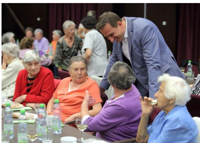
Setkání seniorů s představiteli města