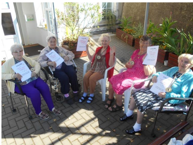
Olympiáda v domově pro seniory