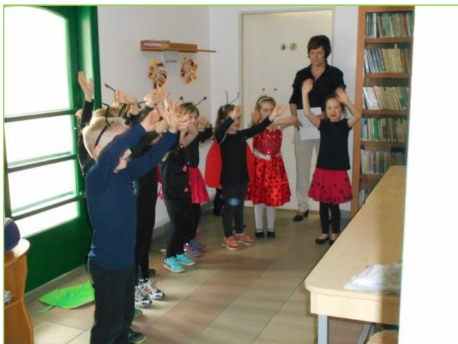
Den matek v DPS