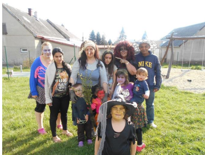
Azylový dům - Pálení čarodějnic