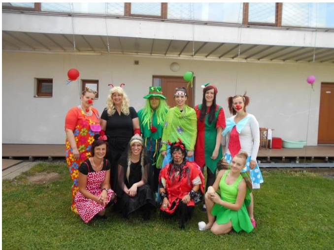
Azylový dům - dětský den