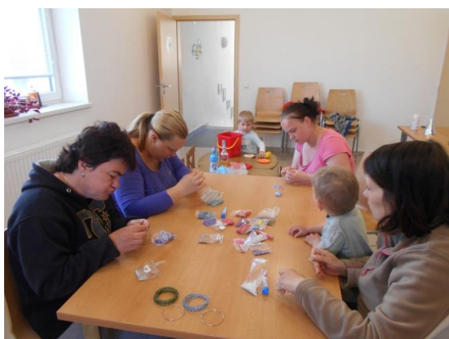
Azylový dům – kreativní tvoření