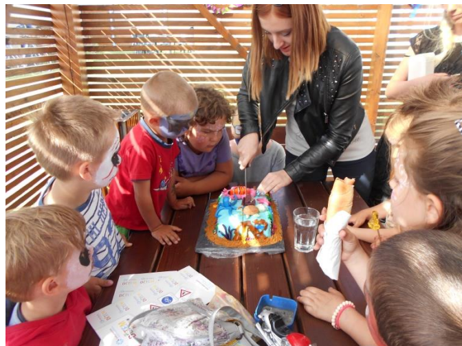
Azylový dům - Dětský den – Dort - Nemo