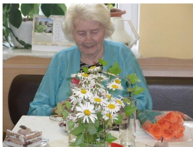
Domov pro seniory - narozeniny