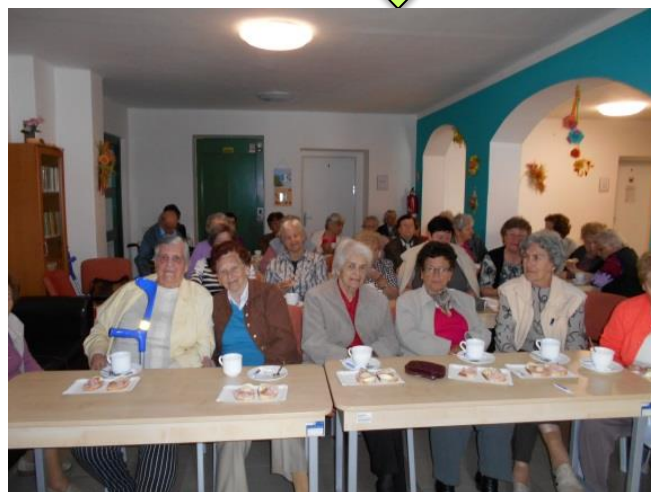
Den matek v DPS