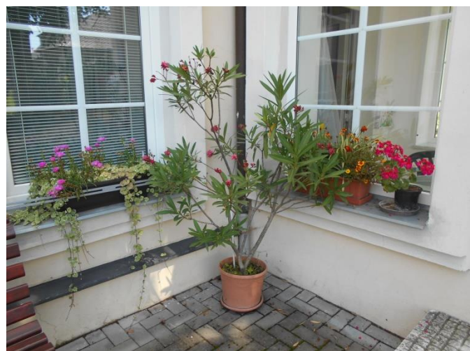
Domov pro seniory - květinová výzdoba