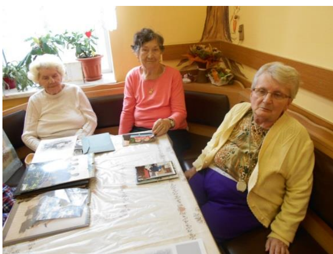
Domov pro seniory – vzpomínání nad fotografiemi