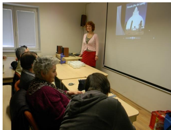
Přednáška o Srí Lance

Klub kultury přináší neustále nové a zajímavé informace a vytváří prostor pro setkávání se s přáteli, organizuje osvětové a kulturní akce, o kterých předem mimo jiné informujeme na stránkách Zpravodaje organizace i na webových stránkách organizace www.socialnisluzby.cz