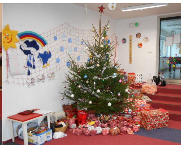
Dárky pro děti