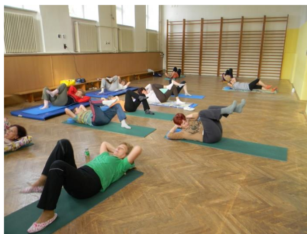
Jóga pro zdraví