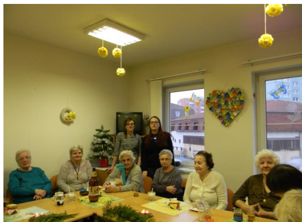
Vánoční posezení v Klubu seniorů

Mimo systém sociálních služeb stojí zájmové kluby – Aktivizační cvičení pro seniory, Jóga pro zdraví, Klub seniorů. Ty fungují pod hlavičkou ambulantních služeb jako zájmové a volnočasové aktivity pro seniory a je jim poskytována především organizační a koordinační podpora.