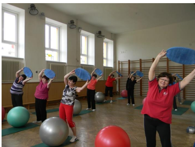
Aktivizační cvičení pro seniory