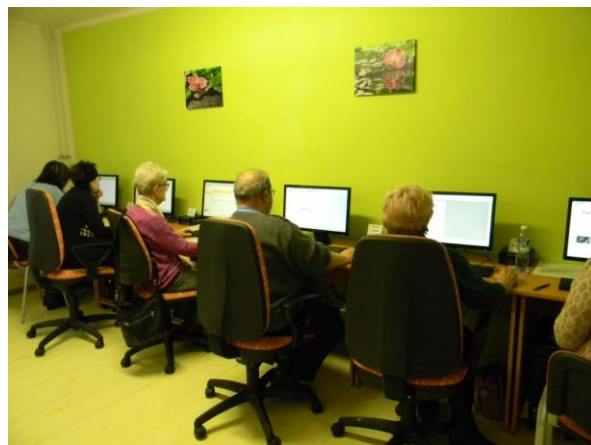
Klub práce s PC a internetem

Díky Klubu práce s PC a internetem se klienti seznámí se základními funkcemi počítače, naučí se vyhledávat informace na internetu, využívat jej ke komunikaci s přáteli, vyměňovat si s nimi fotografie, posílat elektronické pohlednice.