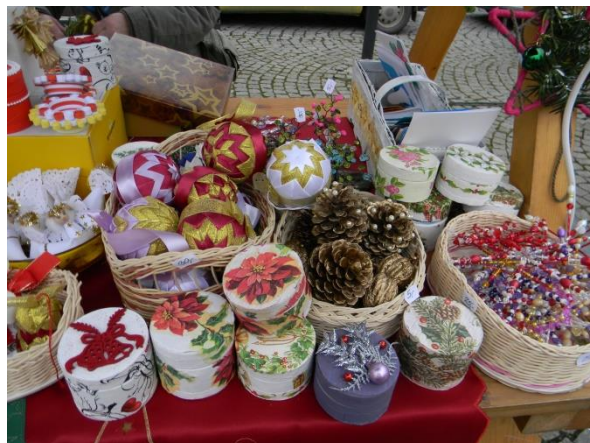
Výrobky klientů organizace při prodeji na Vánočních trzích

Mezi další činnosti sociálně aktivizačních služeb patří Klub ručních dovedností , jehož cílem není jen procvičování jemné motoriky, ale také možnost vlastnoručně si něco vyrobit. Některé věci vyrábějí klienti i doma s vnoučaty, výrobky slouží často jako dárky, jako výzdoba domovů nebo pro prezentaci činnosti organizace.